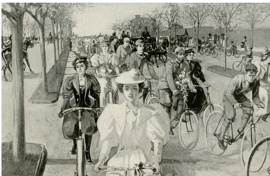
圖片: New York Awheel—On the Riverside Drive, Near the Great Monument , Munsey's Magazine, 1896年5月, 畫家: J.M. Gleeson, 此為私人收藏